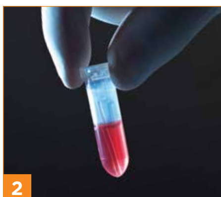
将毛细管放入反应管中并倒置直至混合。20至45秒产生结果。